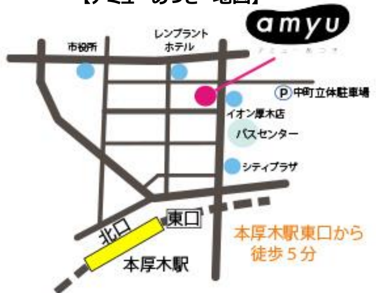
【アミューあつぎ 地図】