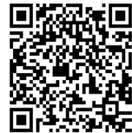
横浜弁護士会ホームページ