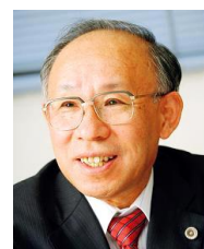
シンポジウムには 宇都宮健児日弁連会長も参加します