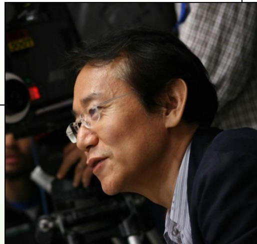
（写真：周防正行さん）